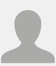
Mme COSSET Cécile